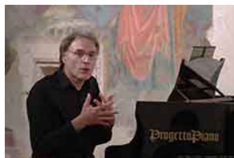
Citta' Di Castello, 1962